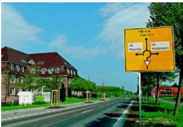
Wer den Ort über die Münsterstraße Richtung Münster verlässt, erreicht die Wolbecker Windmühle über die linke Abfahrt...

Der Gewerbeverein erinnert die Unternehmen eindringlich daran, das Rückantwortfax mit einer Bestätigung der Teilnahme an der Gewerbeschau zeitnah zu versenden. Mündliche Zusagen sind nicht ausreichend.