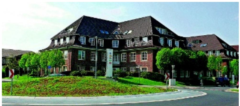
... am großen Kreis. Dort, direkt am Classical Service Center, soll der „Rundgang“ der ersten Wolbecker Gewerbeschau im Juni beginnen.