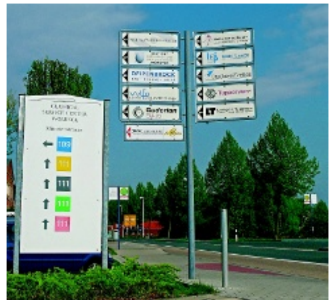
Im Gewerbegebiet Wolbecker Mühle sind viele leistungsstarke Unternehmen beheimatet.

Das CSC begrüßt die Kooperation mit dem Gewerbeverein. Intern gab es unter dem Motto „Gewerbe für Gewerbe“ schon erste Bemühungen, ein kleines Netzwerk zu schaffen. Die Gewerbeschau bietet Möglichkeiten, dies in einer größeren Dimension zu tun. „Es geht einerseits darum, Interesse zu wecken. Auf der anderen Seite können sich auch die Un-